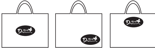
①中心 ②右下 or 左下 ③上 or 下

※園章・ロゴマークをデザインに入れる場合は、鮮明な印刷物 (別紙可) またはデータにて園章をご提出ください。